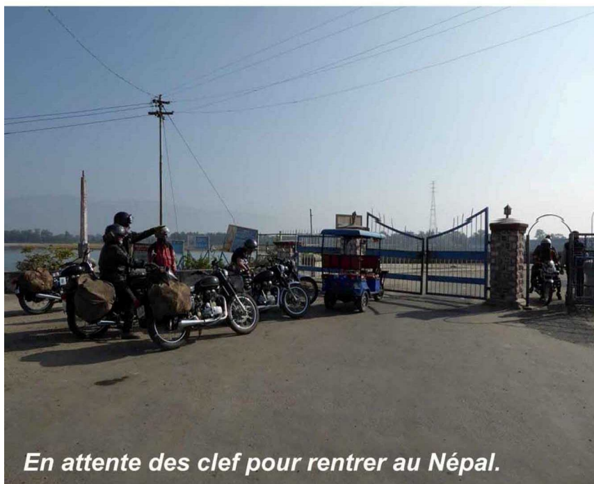
En attente des clef pour rentrer au Népal.

Ce jour, nous montons encore plus haut. A partir du village de Lette, nous sommes au pied du Daulaghiri entouré de hautes montagnes. En cours de route, nous pourrons visiter le village tibétain de Marpha et le sanctuaire de Muktinath. La journée se termine dans le village de Kagbeni où nous passerons la nuit.