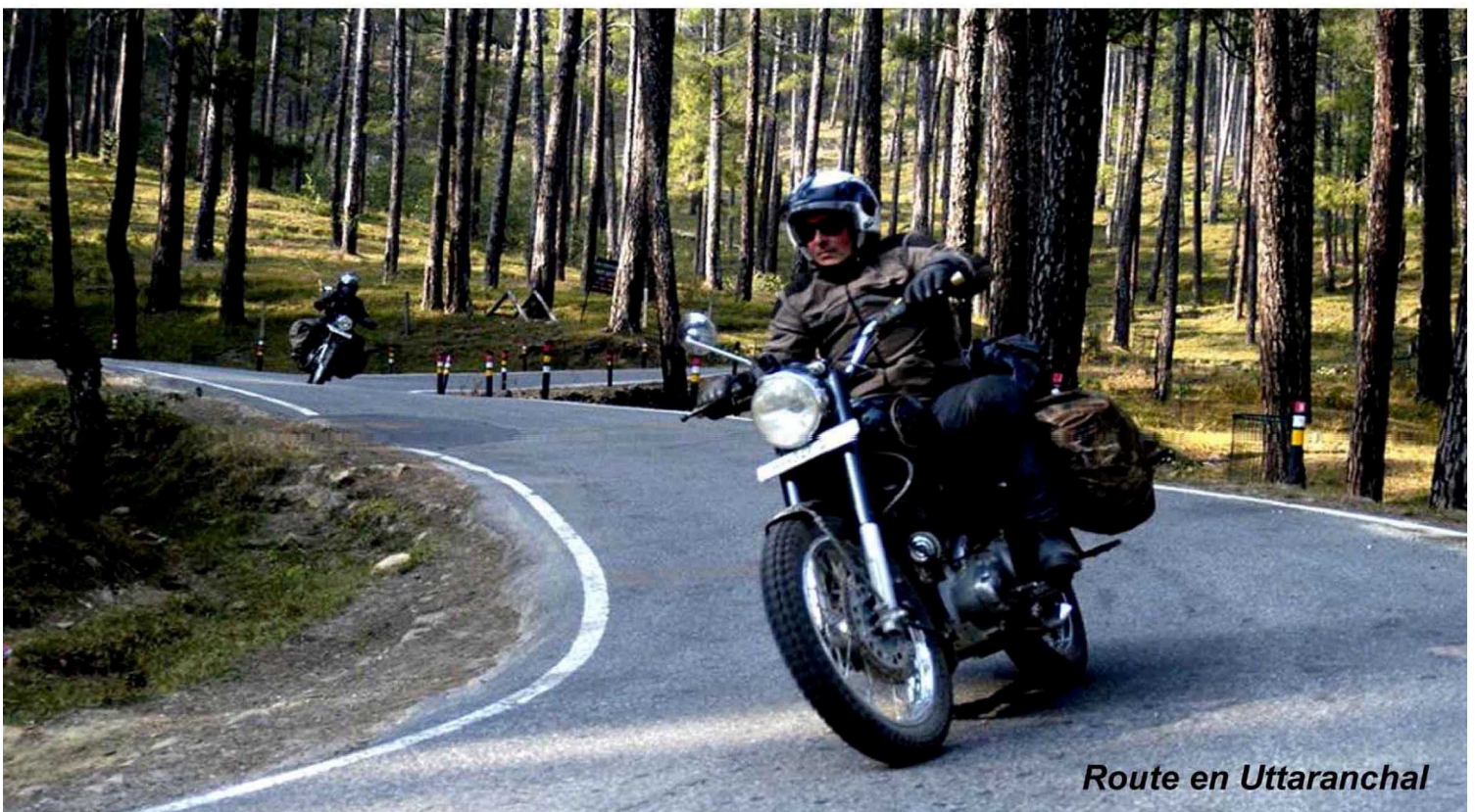
Route en Uttaranchal

Découverte du barrage de Tehri et son lac immense. Rudraprayag est une ville étape. On progresse le long des gorges abruptes du fleuve Alaknanda sur la route des pèlerins vers les lieux sacrés de Shiva. Nuit à l'hôtel