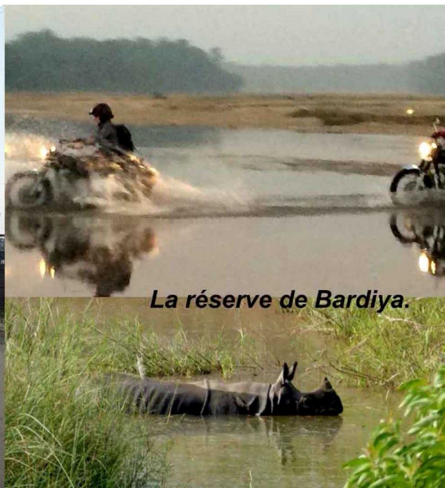
La réserve de Bardiya.