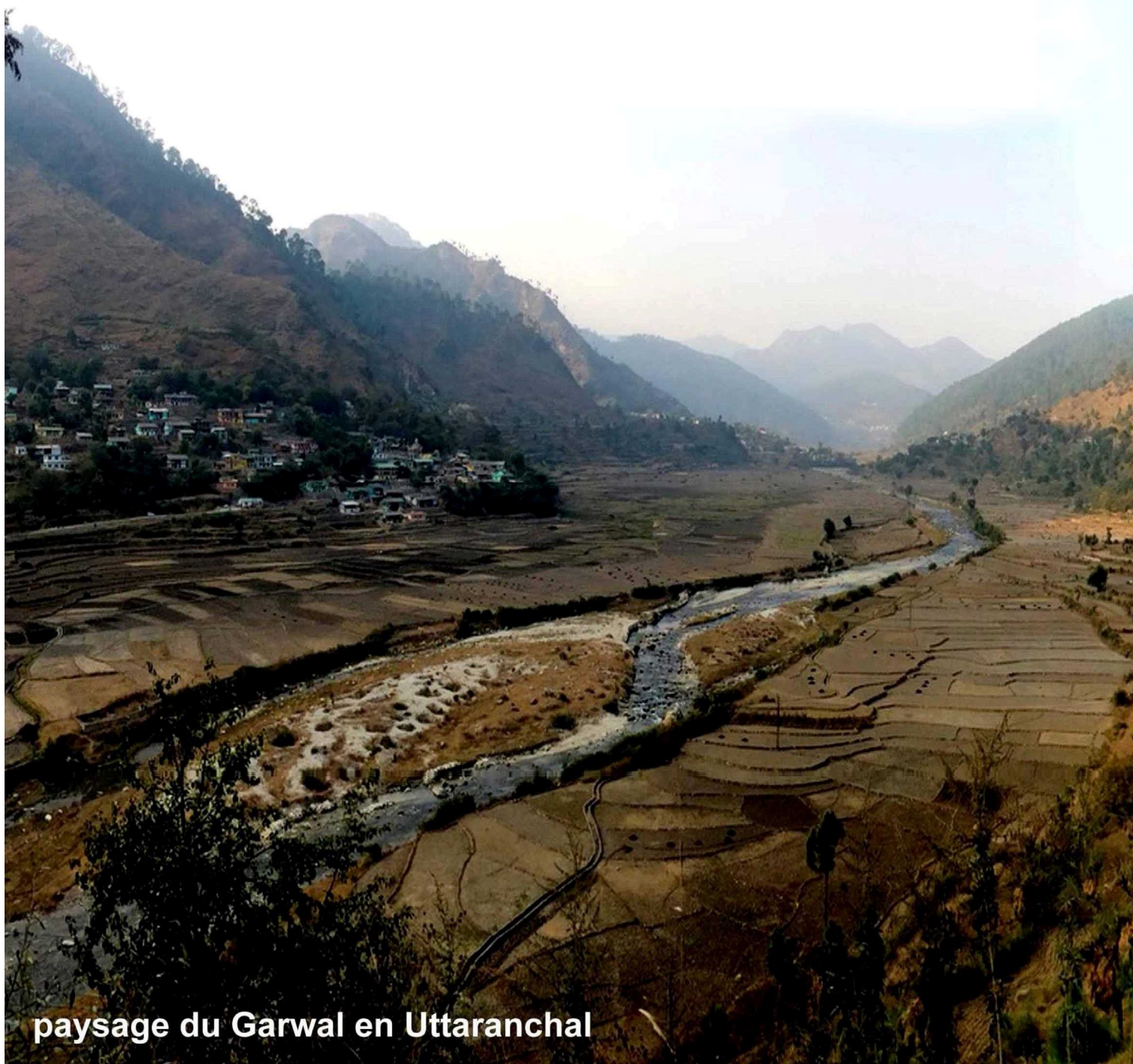
paysage du Garwal en Uttaranchal

Un itinéraire de rouleur qui vous fera parcourir l'Inde et le Népal avec toujours les Himalaya dans le rétroviseur. A la découverte d'un territoire magnifique, révélé par les charmes d'un passage de frontière terrestre, d'une journée safari dans la réserve de Bardiya dans l'Ouest sauvage du Népal, la montée à Muktinath au Mustang et la découverte de la culture tibétaine et Nawari. Le voyage se termine à Katmandou avec une visite organisée.